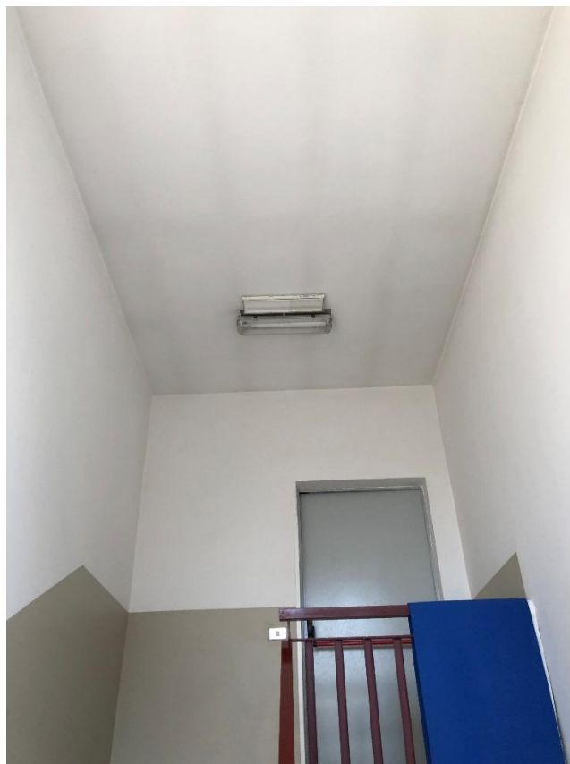
Figura 7 - Plafoniera neon a fluorescenza con 2 tubi da 0,60 m nel vano scala 1