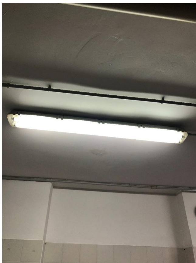
Figura 8 - Plafoniera neon a fluorescenza con 2 tubi da 1,50 m nella cucina