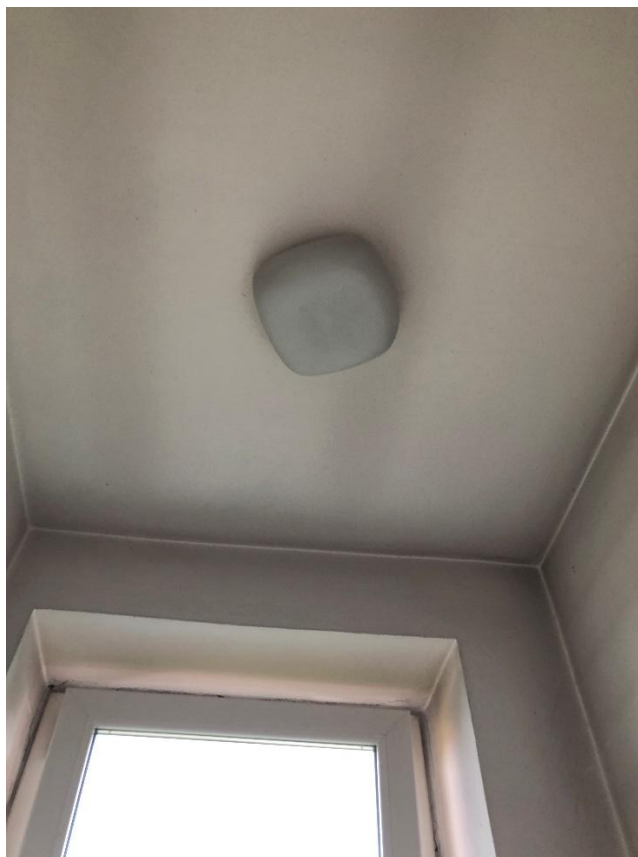
Figura 5 - Plafoniera neon a fluorescenza con 1 tubo circolare nel WC1