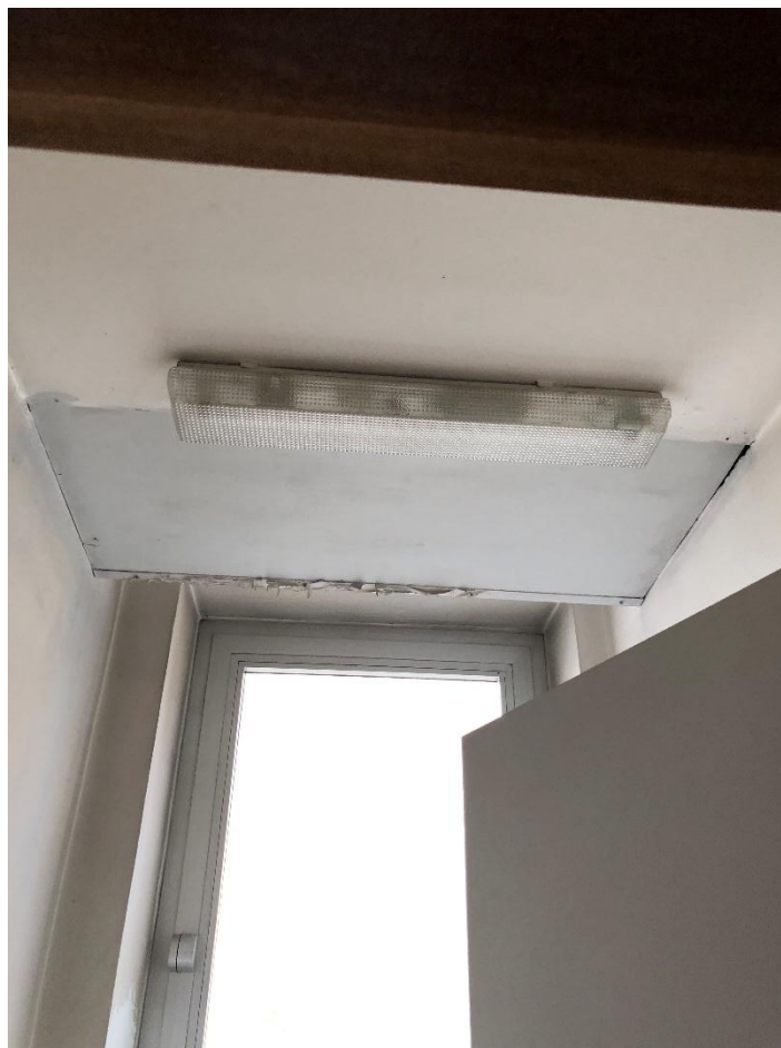
Figura 9 - Plafoniera neon a fluorescenza con 2 tubi da 0,60 m nel WC 8