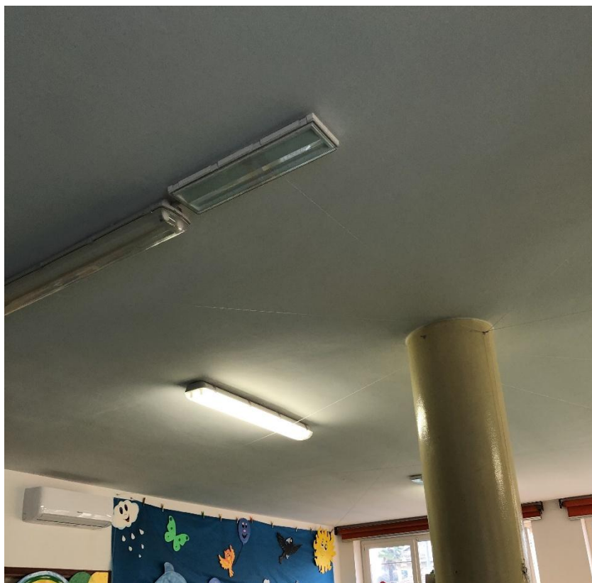
Figura 3 - Plafoniera neon a fluorescenza con 2 tubi da 1,20 m nell'area giochi e pranzo 1