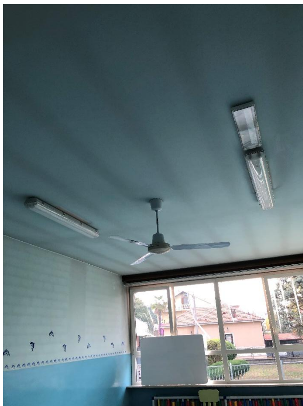
Figura 4 - Plafoniera neon a fluorescenza con 2 tubi da 1,20 m nella stanza psicomotricità 1