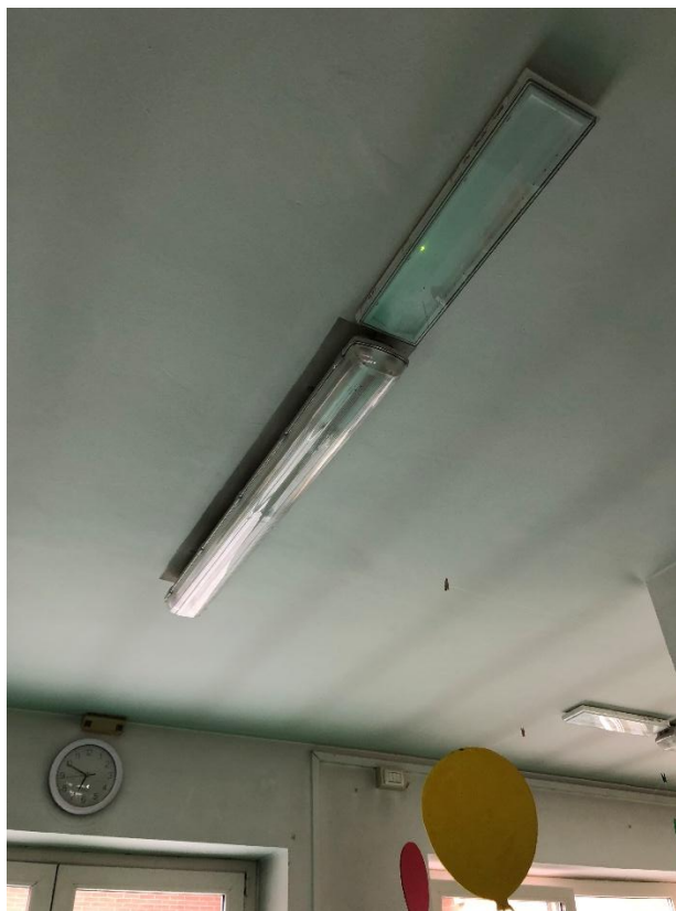
Figura 1 - Plafoniera neon a fluorescenza con 2 tubo da 1,20 m nel corridoio 2