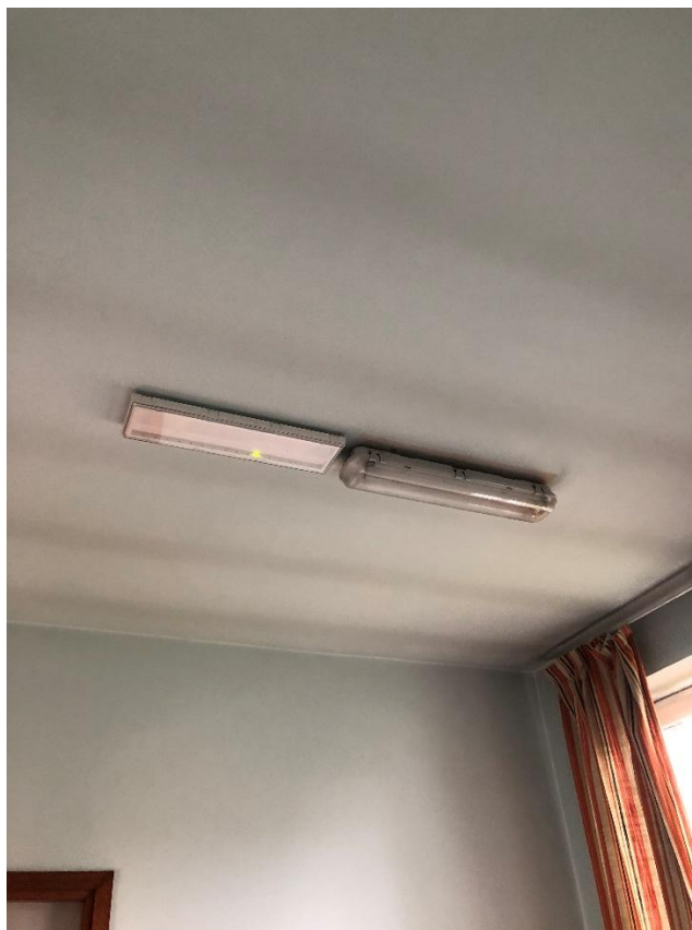
Figura 6 - Plafoniera neon a fluorescenza con 2 tubi da 0,60 m nello spogliatoio 1